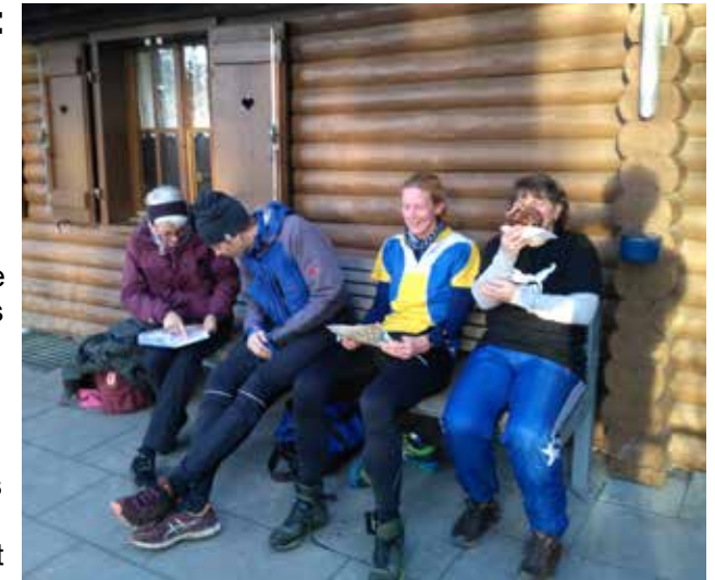
Vor der Fislisbacher Waldhütte

Diesen Winter war ich zwei Mal bei einem OL-Wintertraining dabei. Bei schönstem Wetter einmal auf dem Petersberg und jetzt dieses Mal auf dem Rüsler. Die Idee der Wintertrainings hat voll eingeschlagen, die Teilnahmeliste war bis zur Mitte der dritten Seite gefüllt!! Ganz gelungen fand ich, dass man die Waldhütte für diesen Anlass reserviert hat. Fachsimpelei – bist du aussen rum oder darüber? – das muss doch einfach sein. Auch die vielen anderen Gespräche mit