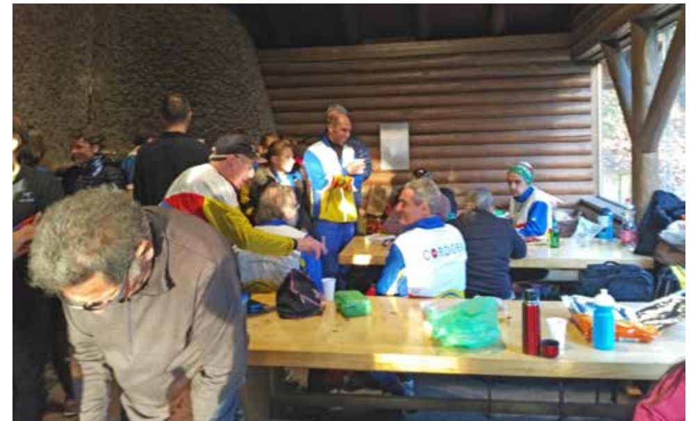
Anmeldung, Garderobe und Austausch im Wintergarten der Waldhütte