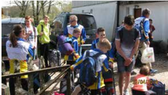
auspacken bei der Unterkunft