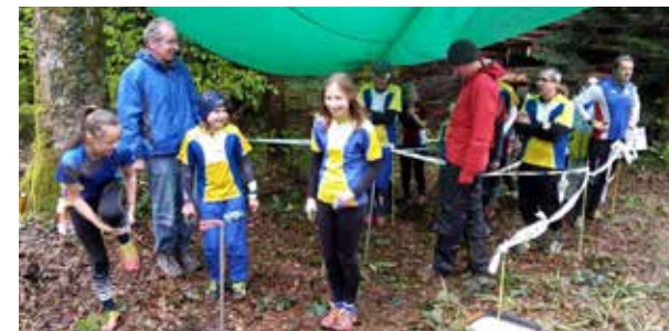
am Start des Seetaler Schüler OLs