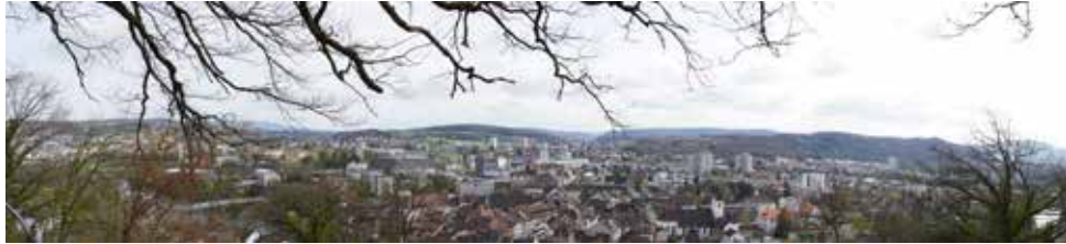
Fernsicht über die Stadt Brugg, aufgenommen vom Hexenplatz im Bruggerberg.

Beim Erhalt dieser Cordoba-Welle geht es noch etwas mehr als 2 Monate bis zum Aargauer 3-Tage-OL vom 16.- 18. August 2019 in Riniken.