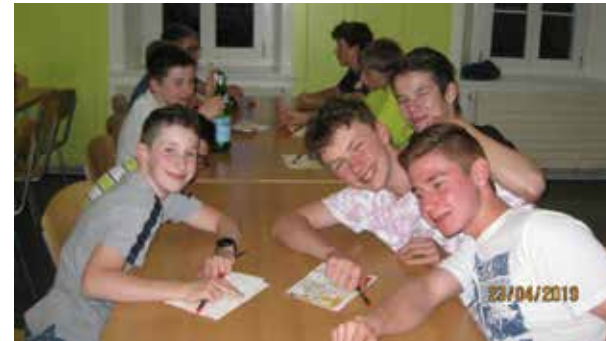
Auswertung am Abend

Die hier fehlenden Seiten des Berichts und viele Fotos sind auf der Homepage