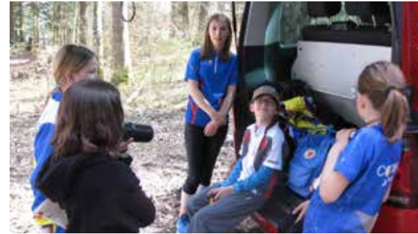
nach dem Training